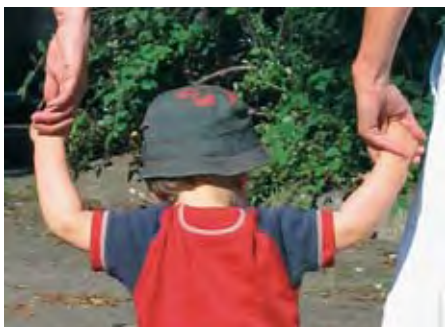
Verbesserte Hilfe für Kinder suchtkranker Eltern durch Kooperationsvereinbarungen