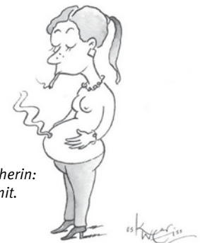
Schwangere Raucherin: Das Baby raucht mit.

Eine Schwangerschaft kann für suchtkranke Frauen eine Chance für einen Neuanfang sein. Geburtshelferinnen und Geburtshelfer sowie Ärzte und Therapeuten helfen dabei.