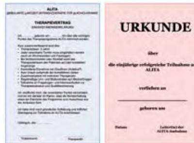
ALITA-Behandlungsvertrag und Abstinenz-Urkunde

Weitere zwölf Monate lang nimmt der Betroffene an wöchentlichen Gruppensitzungen teil, nach Bedarf auch an Einzelgesprächen. Ab dem 13. Monat wird Antabus® abgesetzt.