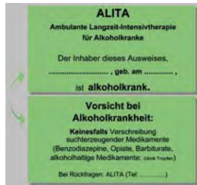
Durch den ALITA-Ausweis bekennen sich die Patienten zu ihrer Krankheit. Er schützt beim Arzt vor einer Verschreibung suchterzeugender Medikamente.