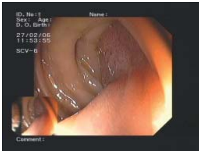
Großer Polyp (Durchmesser etwa zwei Zentimeter) mit kräftigem Stiel. Die Abtragung in einem Stück war möglich.

Polypen und Tumore, die bei Vorsorge-Koloskopie entdeckt wurden, aber nicht endoskopisch abgetragen werden konnten. Sie wurden chirurgisch entfernt.