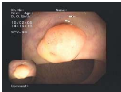
Gutartiges Geschwulst im Mastdarm (Rektum-Polyp), Abtragungsstelle