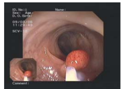
Abtragung eines gutartigen Geschwulstes (Polypen) mit der Elektroschlinge