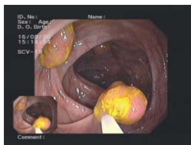
Mehrere Polypen, die nacheinander mit der Schlinge abgetragen werden. Die Polypen werden anschließend in einem Körbchen eingefangen und gemeinsam geborgen.