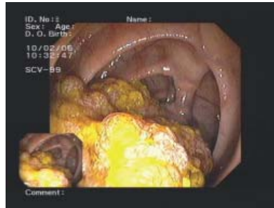
Großer, rasenförmig und blumenkohlartig wachsender Polyp. Eine endoskopische Abtragung war hier nicht möglich.

Polypen und Tumore, die bei Vorsorge-Koloskopie entdeckt wurden, aber nicht endoskopisch abgetragen werden konnten. Sie wurden chirurgisch entfernt.