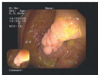
Kurzgestielter lappiger Polyp