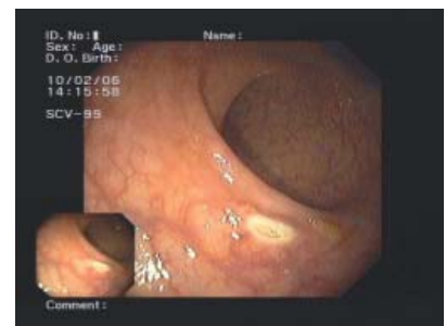
Gutartiges Geschwulst im Mastdarm (Rektum-Polyp), Abtragungsstelle