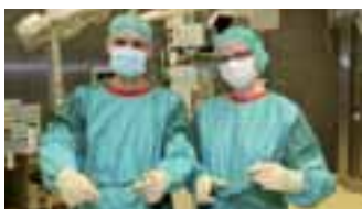
Schule für Operationstechnische Assistenz