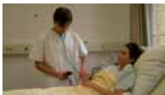
Kranken- u. Kinderkranken- pflageschule