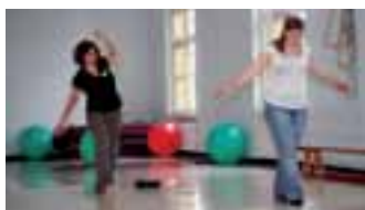
Schule für Physiotherapie